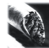
Détail d'un cheveu coupé avec une paire de ciseaux classiques

Norgil vous propose une coupe effectuée avec le système ThermoCut Jaguar TC qui cautérise la pointe des cheveux. Il s'agit de ciseaux cautérisant, dont les lames sont chauffées. Le cheveu recouvre son état naturel et est ainsi protégé de manière efficace contre l'impact de l'environnement. Les cheveux sont plus brillants et la chevelure plus volumineuse.